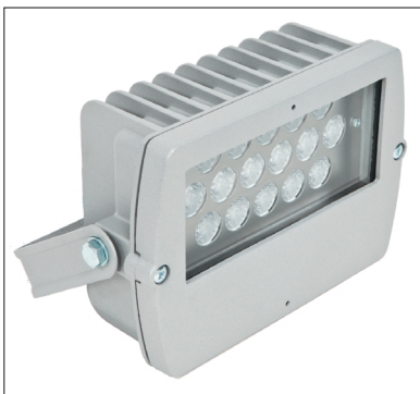
Светодиодный прожектор FL4400