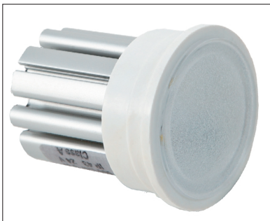
Светодиодная лампочка SPOT в форме стандартного корпуса M16