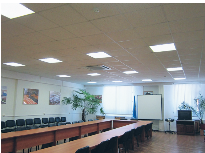
Конференц-зал (светильники INGA)

ных. Кроме того, срок службы светодиодов более 100 тысяч часов — в 100 и 10 раз больше, чем вышеупомянутых ламп. Важную роль играет высокая ударная и вибрационная устойчивость, а также противопожарная безопасность (малое тепловыделение и низкое питающее напряжение — обычно 24–36В). Отсутствие стеклянной колбы сводит к минимуму выход из строя из-за механических повреждений. Установив светодиодные светильники, можно забыть об обслуживании на 10 лет (через 70000 ч светоотдача снизится на 30%,