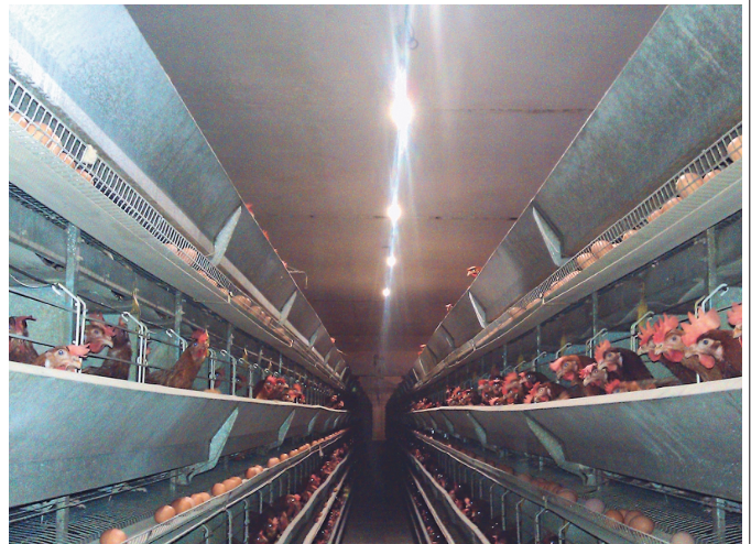
Птичник с несушками в клетке (LINE с 1-м светодиодом)