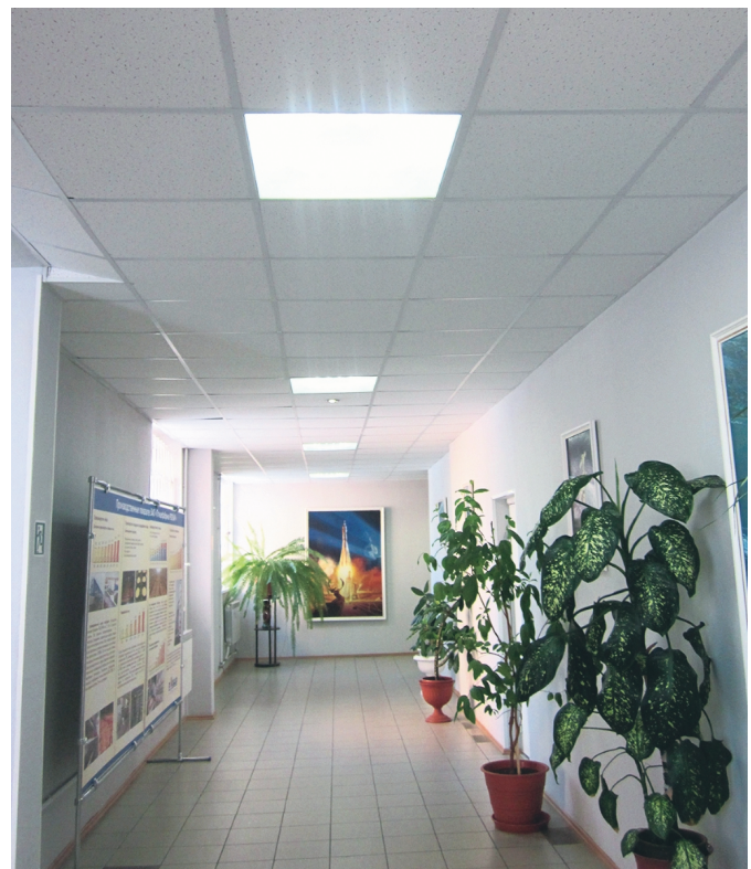
Коридор (светильники INGA)