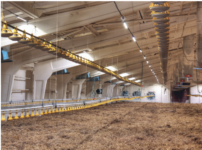
Птичник с бройлерами на полу (LINE с 4-мя светодиодами)