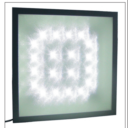
Светодиодный прожектор в стандартном формате Armstrong (600 × 600 мм)

■ по желанию заказчика возможно применение красного, зелёного или синего монохромного света, влияющего на продуктивность птицы.